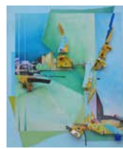
Wim Zwijzen Werk: Schilderijen, constructieschilderijen, tekeningen, Follie Kerk: Westerkerk Kampen